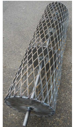
- Fer déployé