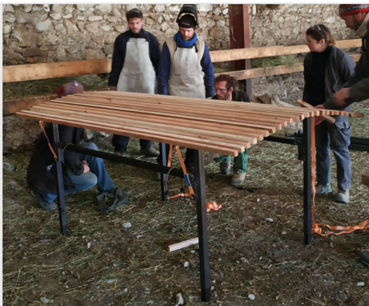
TABLE DE TRI DE TOISON DE MOUTON