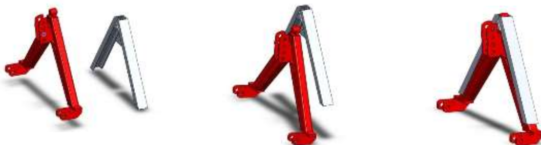
Attelage du triangle mâle (rouge) au triangle femelle