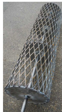
- Fer déployé