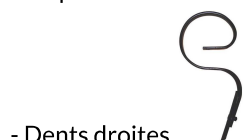
- Dents droites