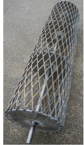
- Fer déployé